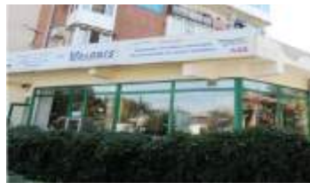
Magazin DRAGASANI , JUD. VALCEA