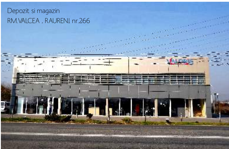
Depozit si magazin RM.VALCEA , RAURENI nr.266